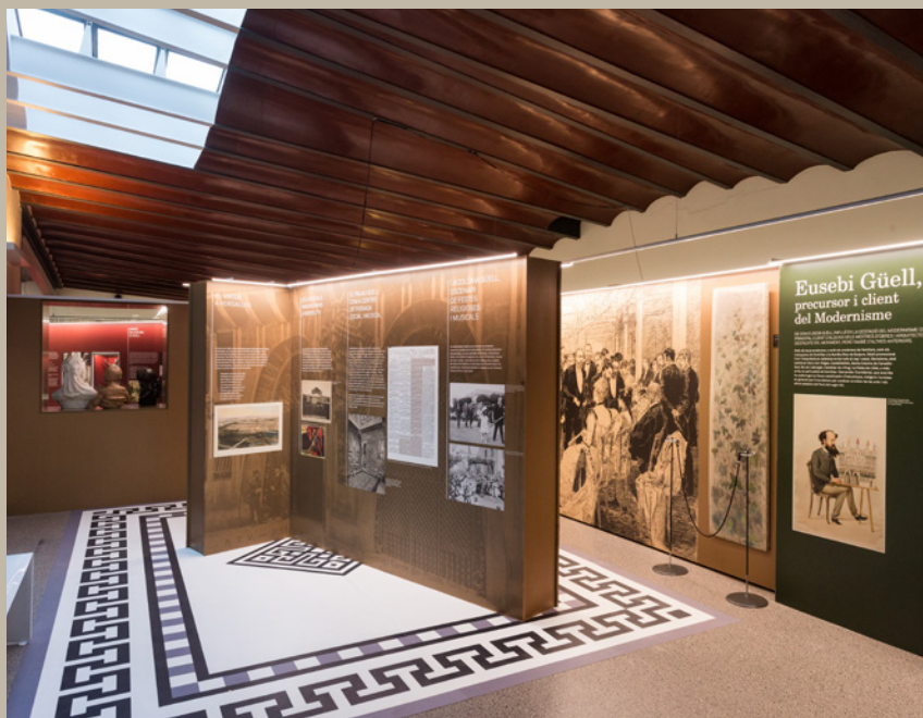
L'exposició «Eusebi Güell i Bacigalupi, patrici de la Renaixença». Òscar Ferrer / Diputació de Barcelona