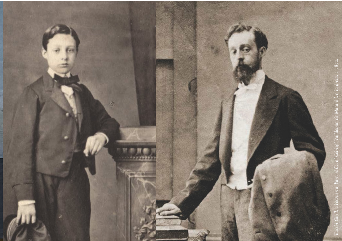
Eusebi Güell, a l'esquerra, l'any 1862, al Col·legi Valldemà de Marató i, a la dreta, c. 1870.